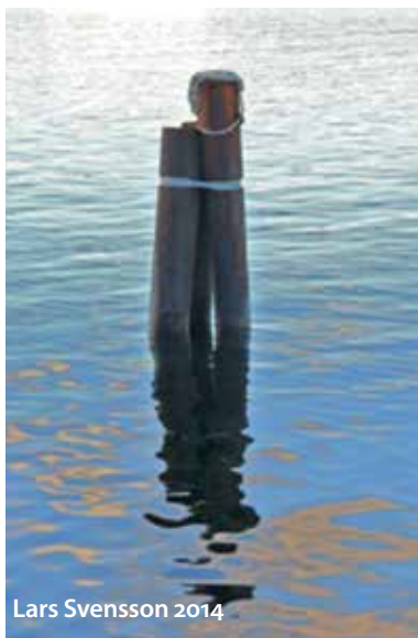
Lars Svensson 2014

NÄR ALMANACKAN planeras kommer det många fina bilder för publicering. Det är alltid svårt att välja! Här finns några av de äldre bildbidragen. Kanske en fotoutställning 2023 i Boden skulle ge mer utrymme åt alla duktiga fotografer? Om du är intresserad hör av dig till mig.